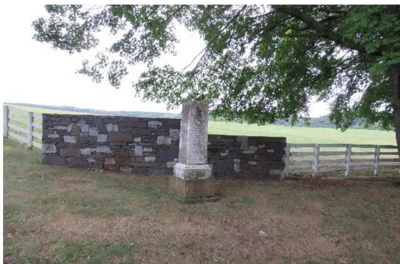
Indiánskou osadu Mohykánů Shekomeko dnes připomíná jen pomník