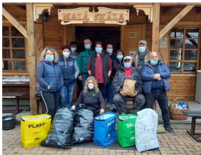
brigáda - akce uklízíme Česko a WK bylo u toho