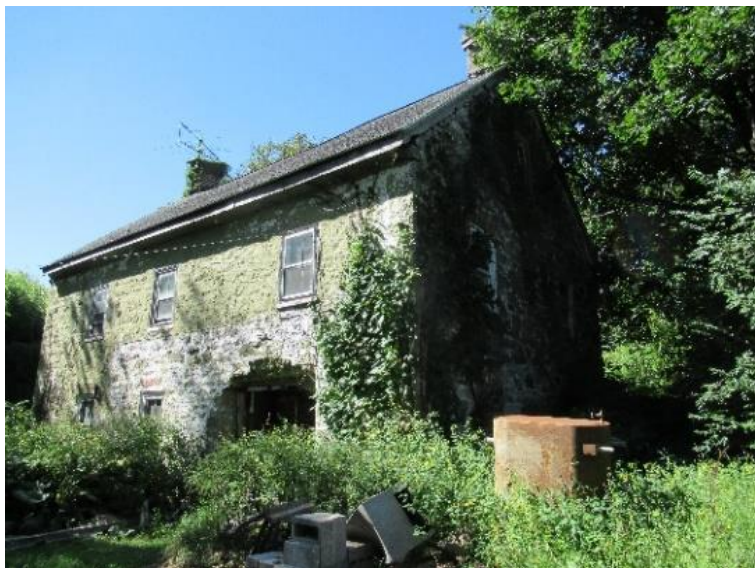
Christians Springs – místo, kde se připravoval na dráhu misionáře