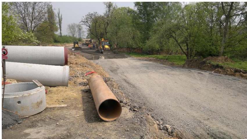
Před 10 lety probíhala intenzivně stavba přeložky komunikace III. třídy